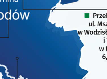
Przebudowa ul. Mszańskiej w Wodzisławiu Śl. i Turskiej w Mszanie 6,7 mln zł