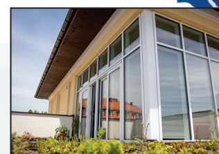
Budowa Oazy Aktywności w Wodzisławiu Śl. 4,2 mln zł