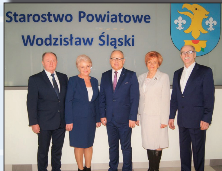
Zarząd Powiatu Wodzisławskiego 2018-2023