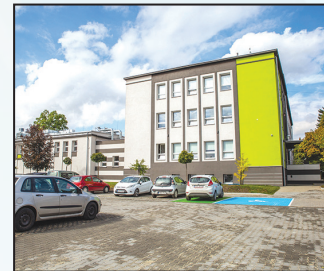
Termomodernizacja i zagospodarowanie terenu wokół ZSP w Rydułtówach 3,3 mln zł