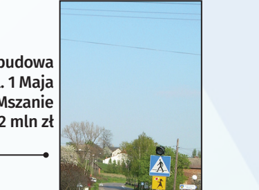
Przebudowa ul. 1 Maja w Mszanie 22 mln zł

2 MIEJSCA W RANKINGU ZWIĄZKU POWIATÓW POLSKICH najwyższe w dotychczasowej historii Powiatu