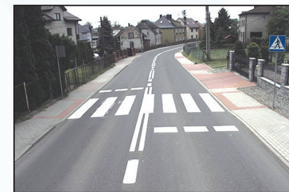
Modernizacja ul. Mickiewicza i Korfantego w Lubomiu 7 mln zł