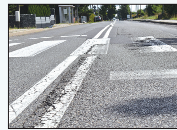
Rozpoczęcie przebudowy ul. Rymera i ul. Głoczyńskiej w Radlinie 6 mln zł