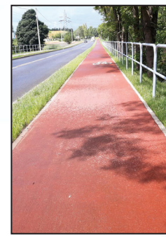
Przebudowa ul. Traugutta w Pszowie 4 mln zł