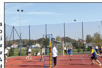
Budowa boiska wielofunkcyjnego i remont sali gimnastycznej w „Tischnerze” w Wodzisławiu Śl. 3,4 mln zł