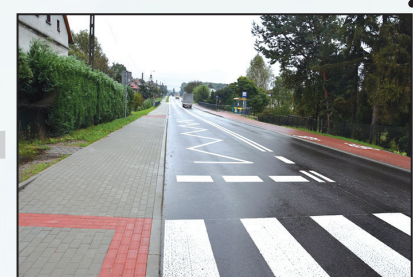
Przebudowa ul. Raciborskiej w Gminie Gorzyce 22 mln zł