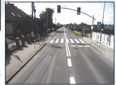
Przebudowa przejść dla pieszych w Markłowicach, Godowie, Gogotowej i Połomi 448 tys. zł