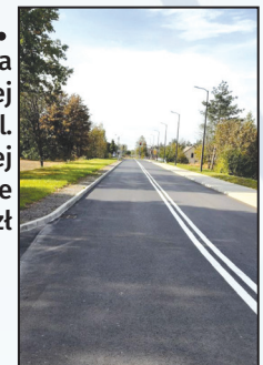
Przebudowa ul. 1 Maja w Mszanie 22 mln zł