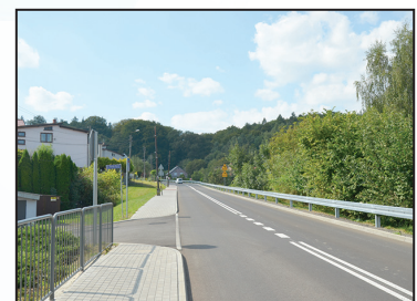
Przebudowa ul. K. Miarki w Pszowie i 3 Maja w Syryni 16,2 mln zł