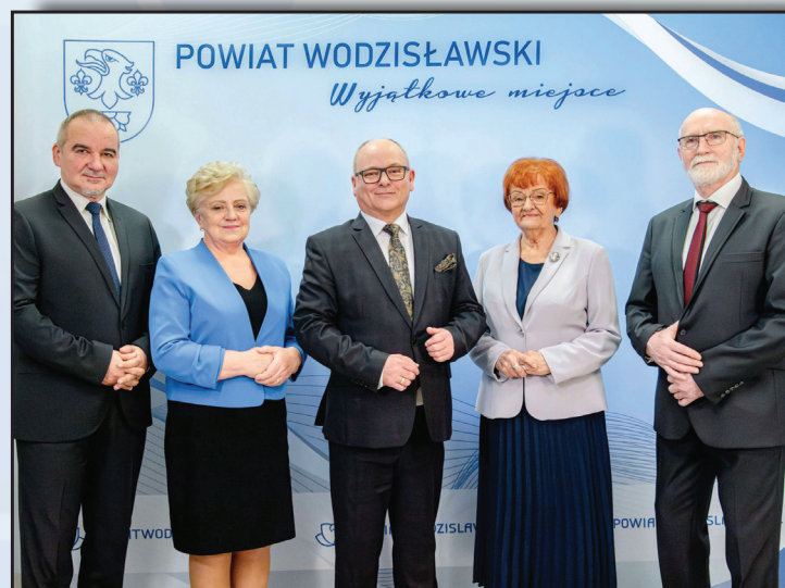
Zarząd Powiatu Wodzisławskiego 2023-2024