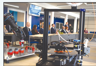
Rozpoczęcie prac przy utworzeniu Branżowego Centrum Umiejętności w Dziejnie Robotyki w Wodzisławiu Śląskim 14 mln zł